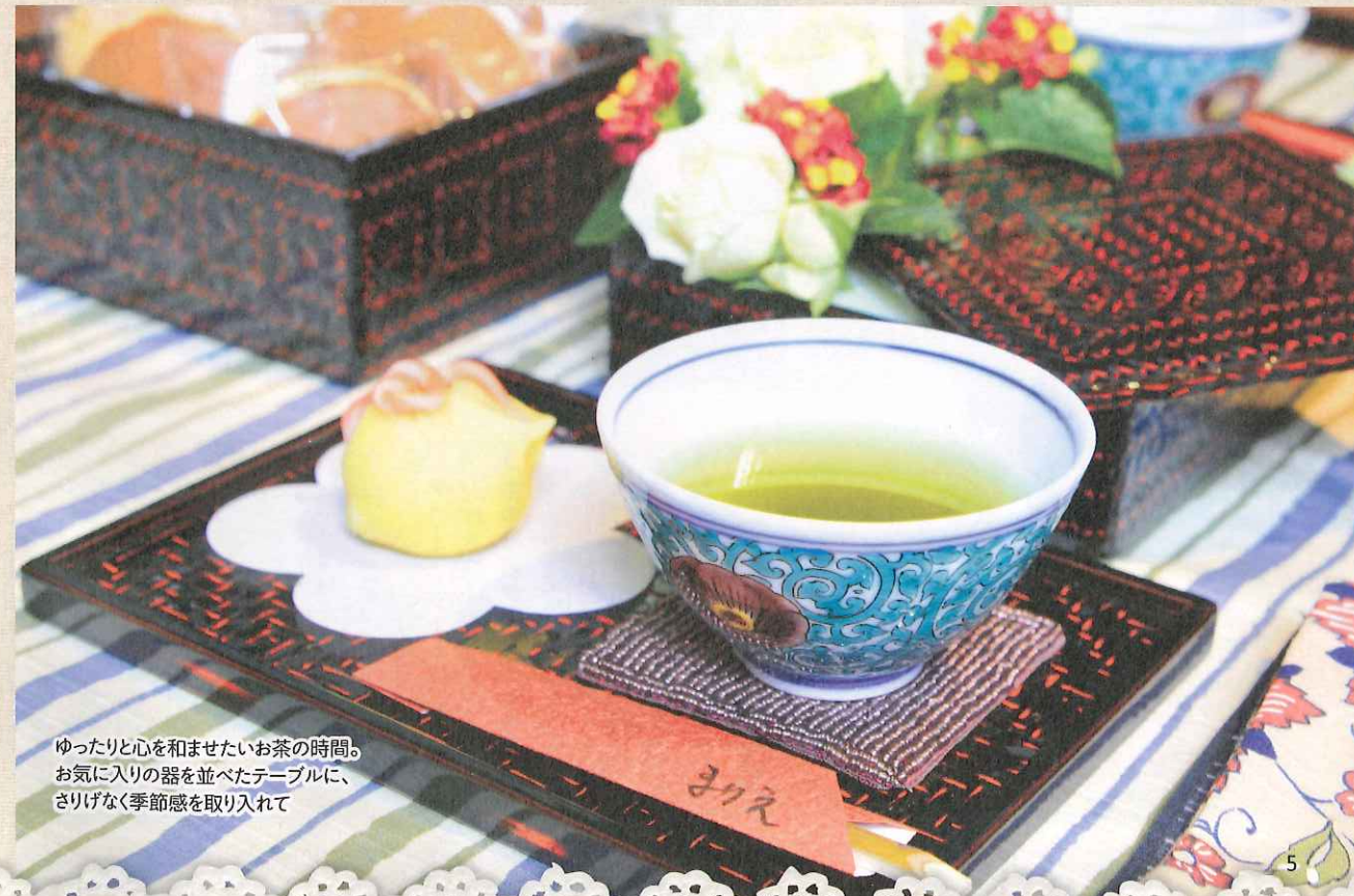
ゆったりと心を和ませたいお茶の時間。お気に入りの器を並べたテーブルに、さりげなく季節感を取り入れて